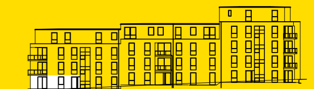
Ansicht Nord West